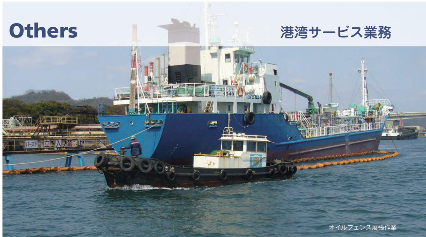
オイルフェンス展張作業