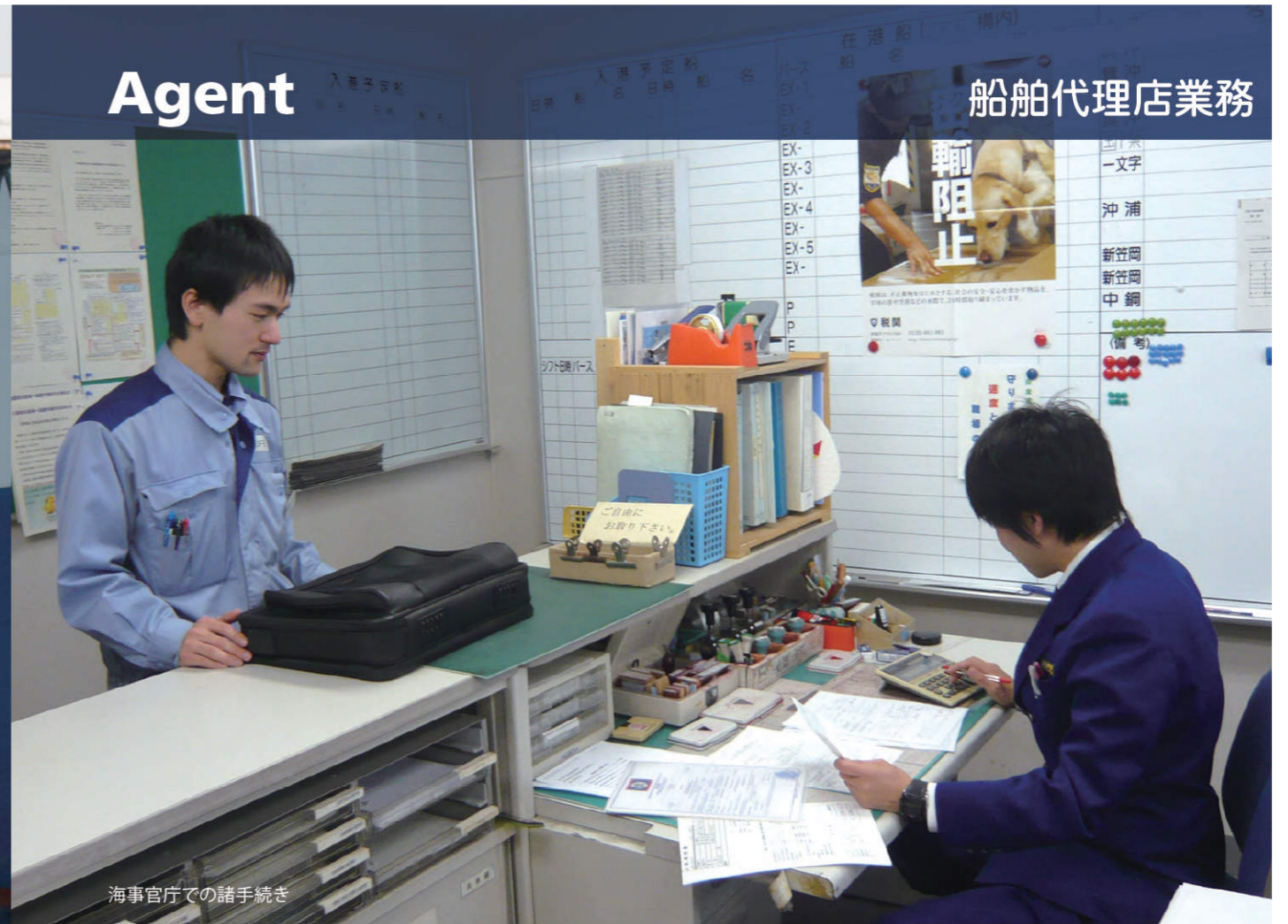
海事官庁での諸手続き