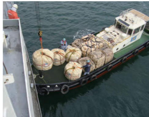
船用品積み込み作業

船用品の積込卸し、オイルフェンスの展張、船舶用給水、海上工事警戒等、各種港湾サービスを行っています。