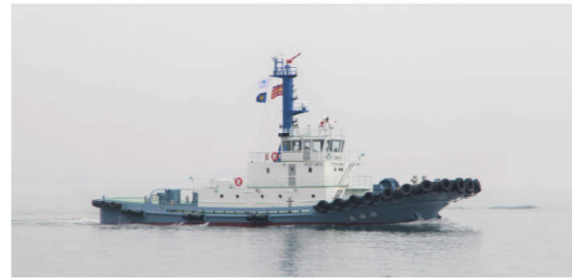
鋼福丸(194 総トン 1324kW×2)