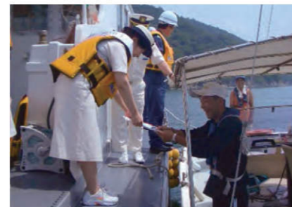
海難防止キャンペーン