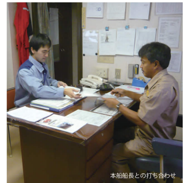
本船船長との打ち合わせ

船舶の入港から出港まで、関係官庁への 申請手続きや、乗組員の乗下船サポート など、多岐にわたるサービスを行って います。